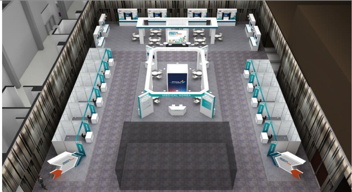
K-의료서비스 홍보관 레이아웃 (안)